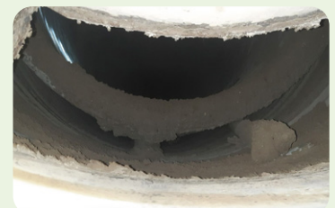
Before เดินเครื่อง 1 สัปดาห์